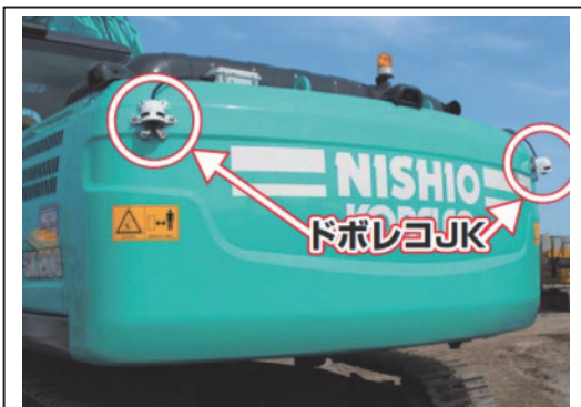
図⑩ ドボレコカメラ部設置図