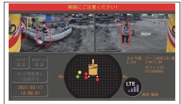
図⑧ オペ室モニター画面

重機取付型セーフティカメラシステム【ドボレコ JK】SX-DB200」(以下、本機器)は、監視カメラ、ドライブレコーダー、接触防止センサの3つの機能を1つにまとめた安全対策機器です。2台の後方設置カメラにより重機後方と側面を広範囲に死角をカバーし、AI人物検知にて人との接近をオペレーターに警告し、映像はクラウドにより遠隔からのリアルタイムモニタリングや録画映像の確認が可能です。本機器は主要な3つの機能がオールインワンで搭載され、安価で管理しやすい機器となります。安全性向上、生産性向上へお役立ていただける新しい安全対策機器として、機能の詳細および特長について発表いたします。