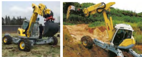
図-7 導入したM545X(左)と国内での施工事例(右)

本フィールドの整備に伴い、災害対応に高い潜在力を持つ施工機械の活用検討や技術開発を行える環境が整ったことから、スパイダーの導入に向け、国内状況を確認し、令和2年までの国内導入実績が林業向け活用を企図した6機程度に留まっている状況ではあるが、メーカー公認オペレータを4名育成した企業の存在、当該企業や販売代理店からの研究への技術的支援の可能性が確認できたため、導入を決定した。