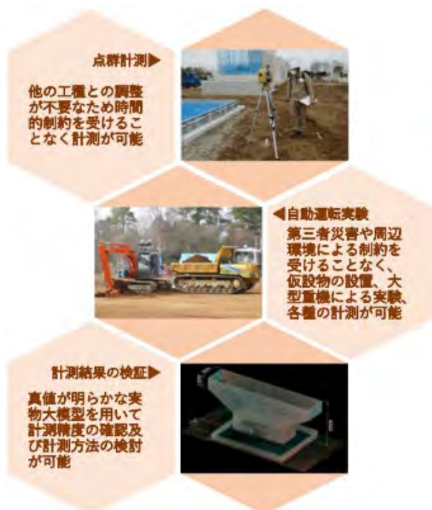
図-4 建設 DX 実験フィールドのユースケース例

図4に示すとおり、実物大の出来形計測模型等を使用し、実際の建設施工現場を想定した実験を行うことができる。