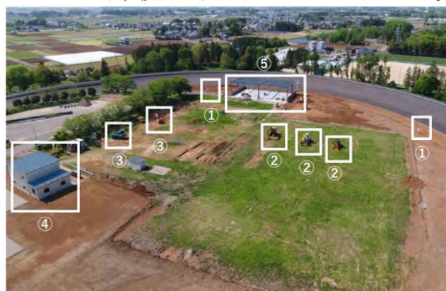
図-5 土工フィールドの全景と施設や建設機械

盛土や切土などの土工を実作業として行える設備として、約26,000㎡の敷地を確保し、遠隔施工や自動化・自律化施工の実験も行えるよう、フィールド全体でローカル5Gや各種wifiが使用可能である。無線基地局は複数配置し、ハンズオーバーも想定した実験、検証に利用することも可能である。