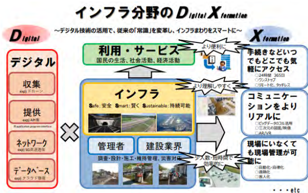
図-1 インフラ分野の DX の全体像

また、令和 2 年からは、インフラ分野の DX (デジタルトランスフォーメーション) として、各種事業のデジタル化と共に、「現場作業の遠隔化・自動化・自律化」を推進し、現場生産性の更なる向上に取り組むこととしている。