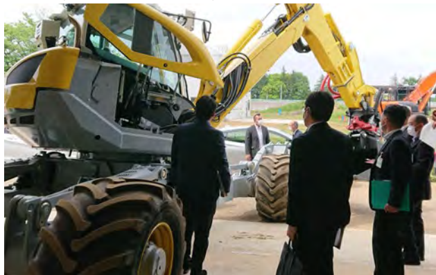
図-8 千葉県消防本部関係者の視察・意見交換