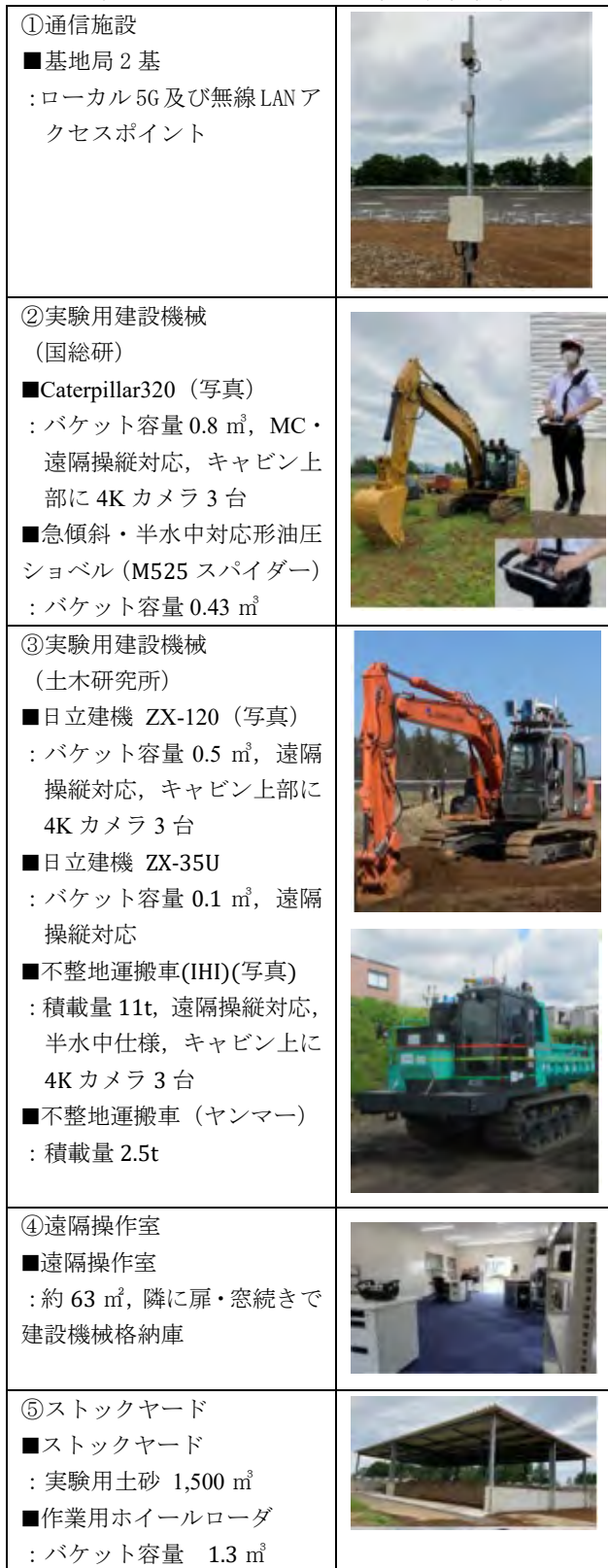
表-2 土エフィールドの施設や建設機械

また、遠隔操作室、機械格納庫、屋根付きのストックヤード、複数の建設機械も用意している。これらの建設機械は今後も拡充する予定であり、それらの計画は、建設DXアクションプランにて、図6の通り計画している。