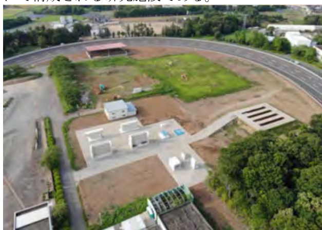
図-3 建設 DX 実験フィールドの全景

活用した遠隔操作の研究開発を行う土工フィールドと、3次元データ等を活用した計測及び検査等に関する技術開発に利用できる、各種コンクリート構造物模型（配筋模型と地下埋設構造物を含む）にて構成される研究施設である。