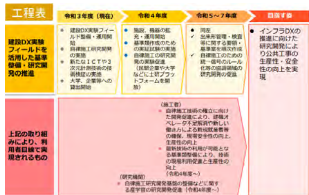
図-6 フィールドを活用した基準類整備・研究の工程表