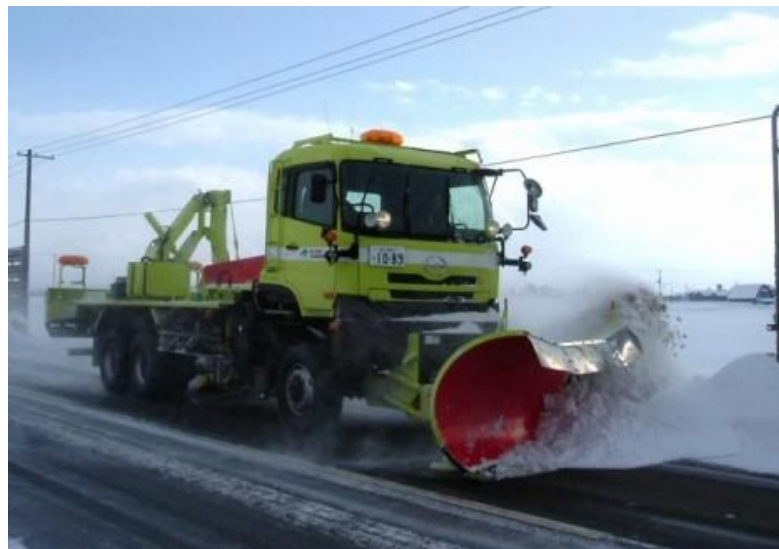
写真 アングリングプラウによる除雪作業(側面から)