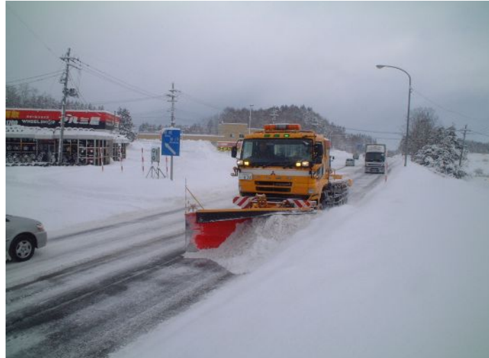
写真 アングリングプラウによる新雪除雪作業