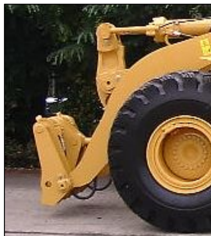
写真 クイックカプラー交換状況(左:プラウ側、右:車両側)