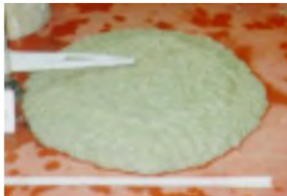
ベースコンクリートの状態 スランブフロー 45cm