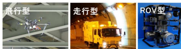
図-2 社会インフラ用ロボットの例

H28、H29年度はH27年度に検証・評価を受けた一部の技術に対して、ロボットによる点検支援の位置付け（ユースケース）を想定した上で、実用化に向けて達成すべき要求性能を設定し、精度検証や作業時間の短縮に伴う経済性等の検証を実施した（H28、29年度：16技術）。検証を行ったロボットの例を図-2に示す。