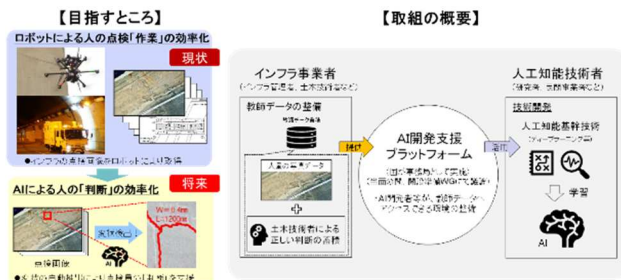
図-6 AI 開発支援プラットフォームの全体像

そこで、国土交通省では、教師データを作成し、これをAI開発者へ提供しAI開発を支援するとともに、開発されたAIの性能評価等を行うことを目的に「AI開発支援プラットフォーム」の設立を検討している(図-6)。