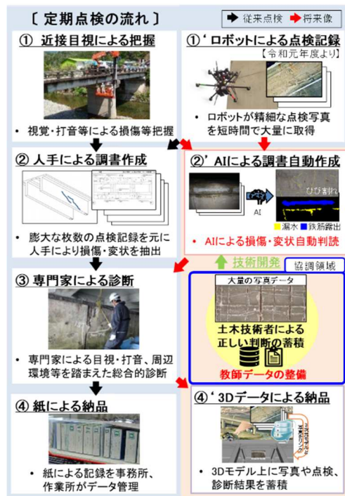
図-4 点検フローの将来像

また、現在は点検支援技術等を用いて取得した大量の写真から、人手により損傷を判読しているが、将来的には人工知能(AI)を活用して損傷を自動判読することにより、点検記録作成に要する人の作業を支援することが出来ると考えている。点検フローの将来像について、図-4に示す。